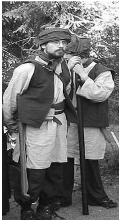
"Al-Quaidas utsendte representanter får også tid til å nyte den norske naturen på sin rundreise i landet"